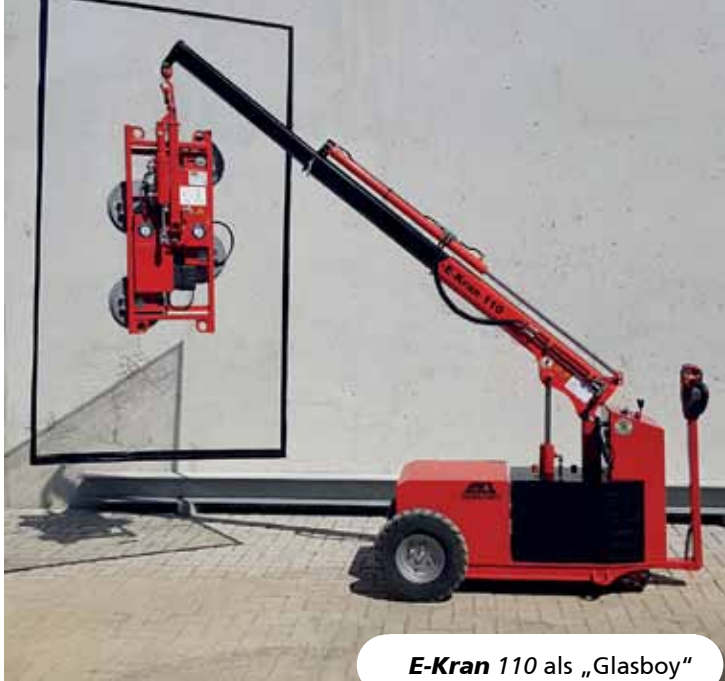
E-Kran 110 als „Glasboy“